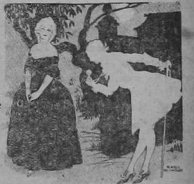
Para calzado de todo color para Señoras

Desfilaron luego niñas y niños a sus comedores, en donde se les sirvió un refresco con abundancia de confites, galletas y cuanta golosina podía exigir su deseo, mostrándose todos muy agradecidos con el señor Artavia y su señora esposa, por las horas de alegría que les habían ofrecido, haciéndose intérprete una de las niñas del sentimiento de gratitud de sus compañeritos, al pronunciar un discurso de gracias para los obsequiantes.