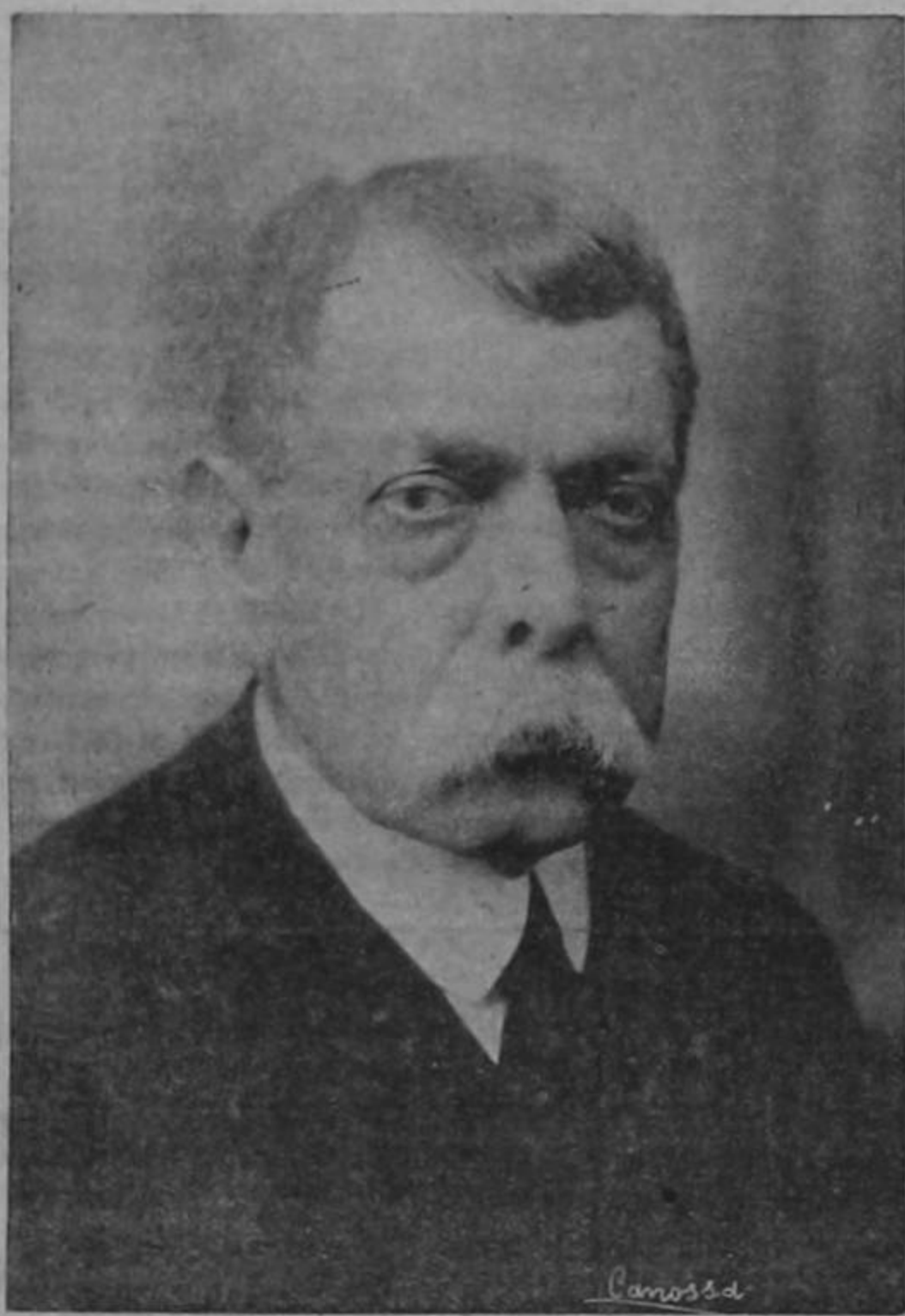
Lic. don Bernardo Soto Alfaro

Mañana, celebra el 75 aniversario de su natalicio, el señor Ex-Presidente de la República Lic. don Bernardo Soto Alfaro, a quien con tal motivo nos es muy grato anticipar nuestro saludo. El Lic. Soto Alfaro, ocupó el Poder en el año de 1885, en momentos difíciles para la Soberanía Nacional, por la invasión de Barrios hacia las demás Repúblicas de Centro América, y a pesar de su juventud, mostró los bríos del patriotismo y la